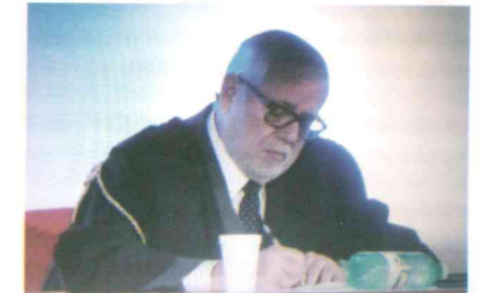
Giovanni Maria Flick

Il teste non può chiedere, deve limitarsi a deporre. Sarei abbastanza perplesso, già abbiamo testimoni che esprimono valutazioni invece di riferire fatti. E se un testimone per esprimere le proprie valutazioni deve usare risorse tecnologiche, mi preoccupa molto. Esprimo perplessità, ma mi rimetto al collegio.